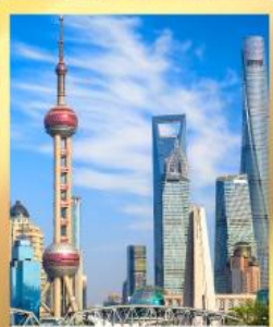
เซี่ยงไฮ้