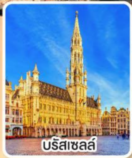
บรีซาเซล