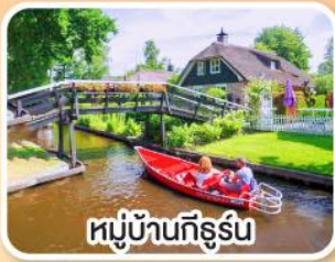
หมู่บ้านทึร์น