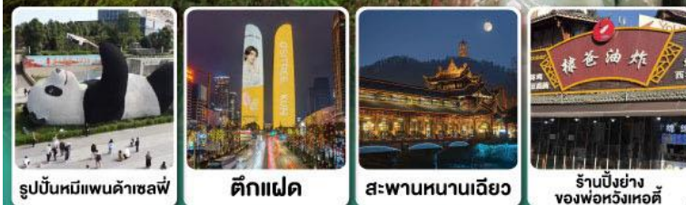
รูปปั้นหมีแพนด้าเซลฟ์ ดิ็กแฝด สะพานหนานเฉียว ร้านปิ้งย่างของพ่อหวังหอดี้

แวะชิมปิ้งย่างหม่าล่า ร้านคุณพ่อ (แว้งแอดตี้) ที่เมืองเล่อซาน