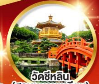
วัดซีหลิน (สวนหนานเท่ลิยง)