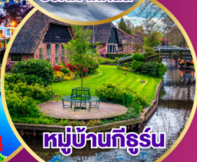
หมู่บ้านที่รูร์น

เดินทาง 30 เม.ย.-09 พ.ค. 68 03-11 พ.ค. 68