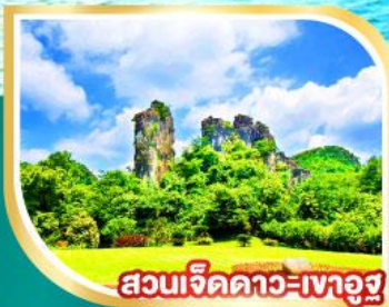
สวนเจ็ดดาว-เกาอูซู