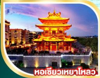
หอเซียวเหยาไหล