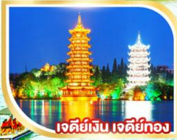
เจดีย์เงิน เจดีย์ทอง