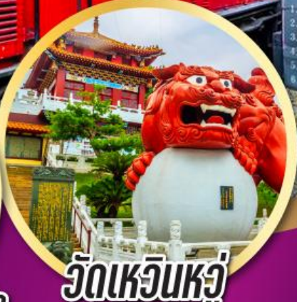
วัดเหวินหวู่