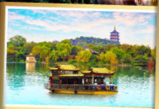
ล่องเรือทะเลสาบซีหู