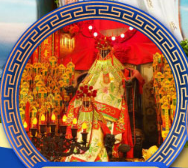
วัดเจ้าแม่กวนอิม อ่องอำ