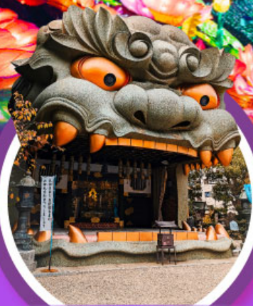
ศาลเจ้านิมบะ ยาชากะ

ชมเทศกาลดอกซากุระบานในคาวาซุ ชมงานประดับไฟ 1 ใน 3 ของญี่ปุ่น อิซุโคเก็น แกรนด์อิลลูมิเนชัน