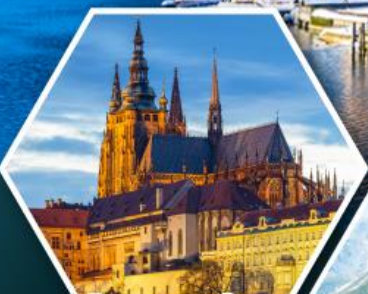
ปราสาทปราก