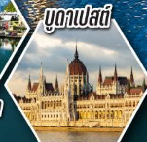
บูดาเปสต์