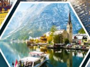
ล่องเรือ ทะเลสาบอัลสตัด