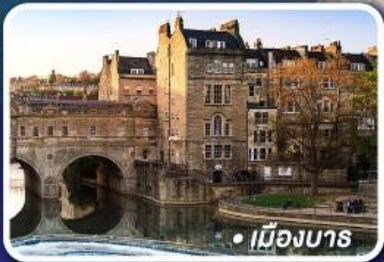
• เมืองบาส

• ถ่ายรูปสนามฟุตบอลแอนฟิลด์ สนามฟุตบอลโอลด์แทรฟฟอร์ด