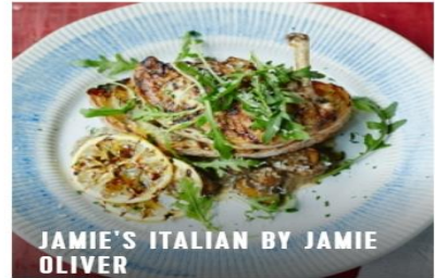
JAMIE'S ITALIAN BY JAMIE OLIVER