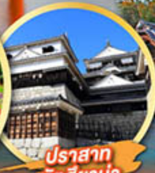
ปราสาท มัตสึยาม่า