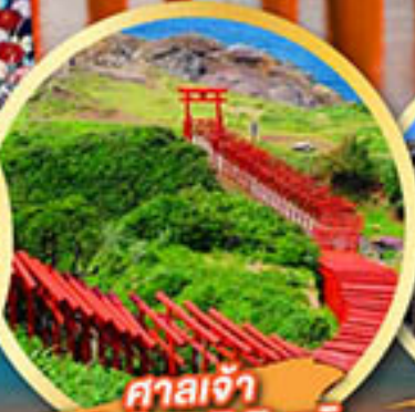
ศาลเจ้า ไมโคโนะซุมิ อินาริ