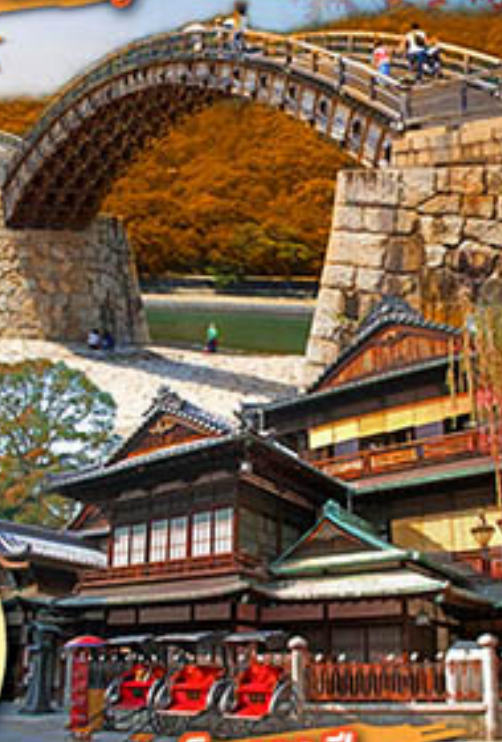
ออนเซ็น 300 ปี โดโจออนเซ็น