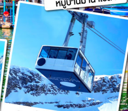
กระเช้ากลาเซียร์ 3000