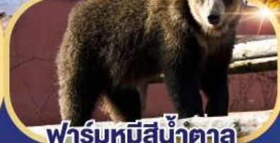
ฟาร์มหมีสีน้ำตาล

เที่ยวเต็มทุกวัน ไม่มีฟรีเคย์ ชมใบไม้เปลี่ยนสีหุบเขานรกจิโกกุคานิ