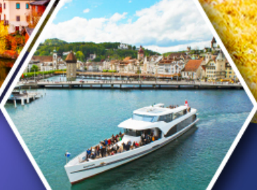
ล่องเรือทะเลสาบลูเซิร์น

กาสิโน พักค้างคืนบนยอดเขาพีลาตุส ยอดเขาคินมังกกรแห่งสวิตเซอร์แลนด์