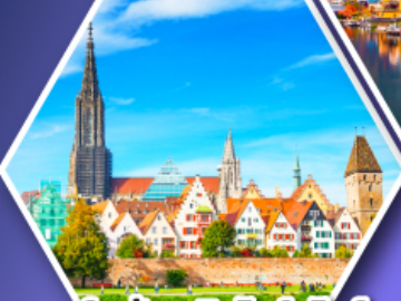
อูล์มบ้านเกิดไอน์สไตน์