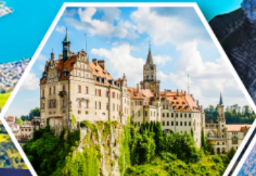
ปราสาทชิกมารังเก็ม

ฟรี ประกัน สุขภาพ และอุบัติเหตุ ไทยวิวัฒน์ GTIP Plus (Gold Plan) 3 ล้านบาท *คุ้มครองสูงสุด **เงื่อนไขขึ้นอยู่กับเงื่อนไขกำหนด ความคุ้มครองเป็นไปตามกรมธรรม์ประกันภัย