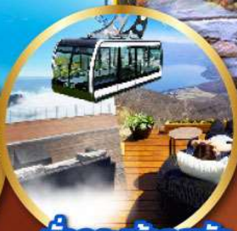
นังกระเข้าอุซซัง

พิเศษ!! บัฟเฟ่ต์ร้าน NANDA ดีที่สุดในชิปปังโร