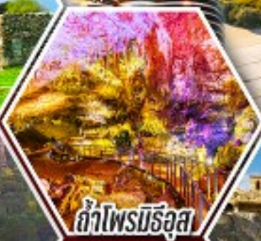
สภาไฟรบิรอส