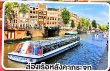
ล่องเรือหลังคากระจก