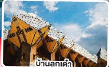
บ้านลูกเต่า