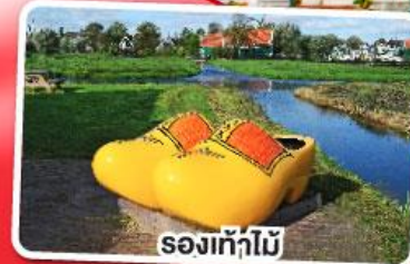
รองเท้าไม้