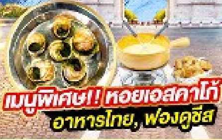
เมนูพิเศษ! หอยเอสคาโก้ อาหารไทย, พังคูน