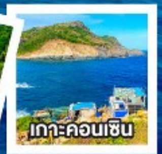
เกาะคอนซอน