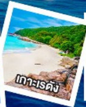
เกาะเรดัง