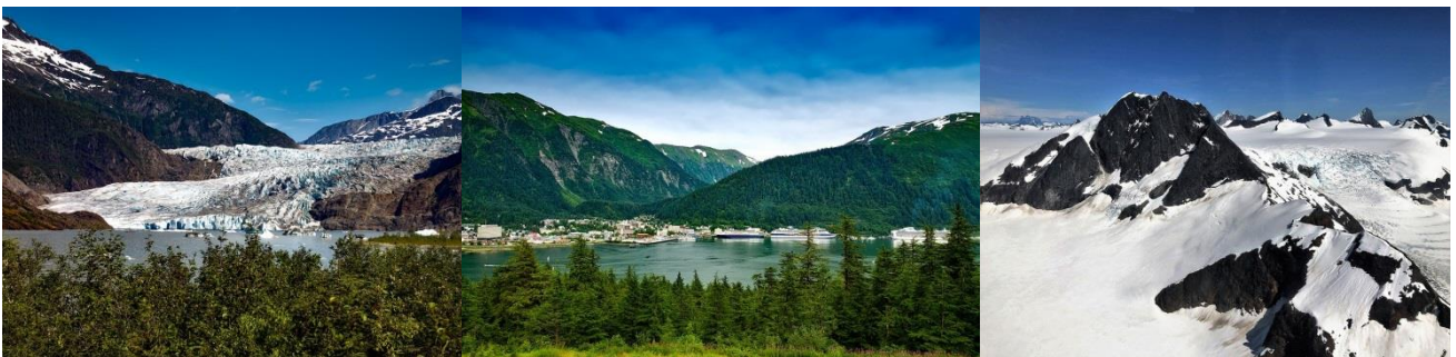
ที่สะดวกเดินทางท่องเที่ยวเองสามารถลงจากเรือหลังเวลาเรือจอด 1 ชั่วโมง ณ บริเวณท่าเรือ และกรุณากลับถึงเรือ ก่อนเรือออก 1 ชั่วโมง

จูโน เมืองหลวงของรัฐอลาสก้า ถึงแม้จะมีขนาดเล็กกว่าอีกหลายเมืองแต่ เนื่องจากเป็นเมืองที่อยู่ใกล้กับแผ่นดินใหญ่มากที่สุด นอกจากความน่ารักและสวยงามผสมผสานระหว่างความเก่าและ ใหม่ของเมืองเป็นจุดที่นักท่องเที่ยวสนใจ ยังมีสถานที่ท่องเที่ยวอื่นๆ อีกที่น่าสนใจ เช่น ธารน้ำแข็งเมนเดนฮอลล์ (Mendenhall Glacier)ที่ท่านสามารถเข้าไปสำรวจในถ้ำน้ำแข็ง,เทรซี่ อาร์ม ฟยอร์ด (Tracy Arm Fjord) ที่ห้ามพลาด ฟยอร์ดที่เกิดจากการกัดเซาะของธารน้ำแข็ง จนกลายเป็นส่วนเว้าที่เรือสามารถล่องผ่านได้ ถือได้ว่าเป็นจุดหมายปลายทางถึงของการล่องเรือสำราญในเส้นทางอลาสก้านี้ ท่านสามารถเดินท่องเที่ยวในตัวเมืองได้อย่างอิสระ หรือ ท่านสามารถเลือกซื้อทัวร์ชายฝั่ง(Shore Excursion) ได้กับทางเรือ ทัวร์ที่แนะนำคือ 1.นั่ง เฮลิคอปเตอร์ขึ้นไปบนธารน้ำแข็งเมนเดนฮอลล์ พร้อมกับการเดินชมถ้ำน้ำแข็ง หรือจะสนุกสนานกับการชมเหล่าสุนัขไซบีเรียน ฮัสกี้สุดแสนน่ารัก หรือกิจกรรมสุนัขลากเลื่อน(Dog Sledding)