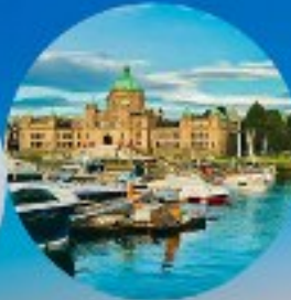
Victoria, British Columbia (Canada)