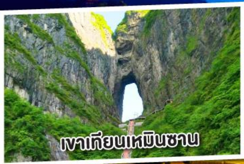
เขาเทียนเหมินซาน