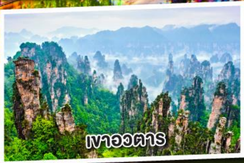
เขาอวดาร