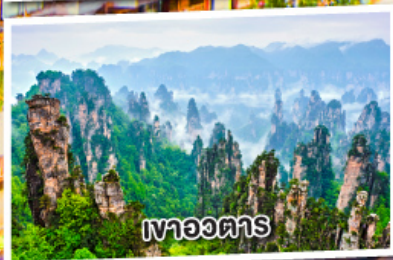
เขาอวตาร