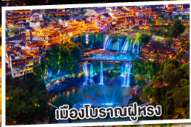
เมืองโบราณฝูหลง