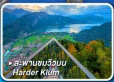
• สะพานชมวิวน Harder Klum