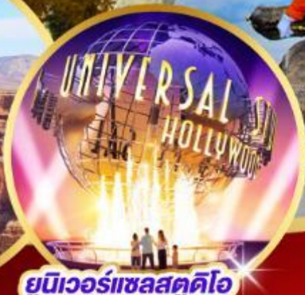
ยูนิเวอร์แซลสตูดิโอ