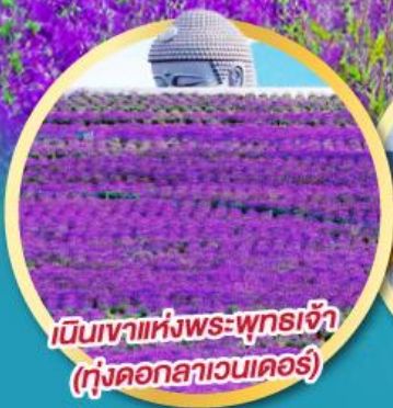
เป็นเขาแห่งพระพุทธรเจ้า (ทุ่งดอกลาเวนเดอร์)

บุฟเฟ่ต์เมลอนหอมหวาน กิจกรรมเก็บเชอร์รี่สดๆ จากต้น