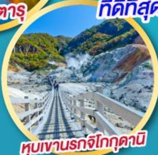
หุบเขานรกจิกุกุดานิ

พิเศษ! บุฟเฟ่ร์ร้าน Nanda ที่ดีที่สุด ใน ซัปโปโร