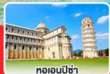
หอเอนปิซ่า