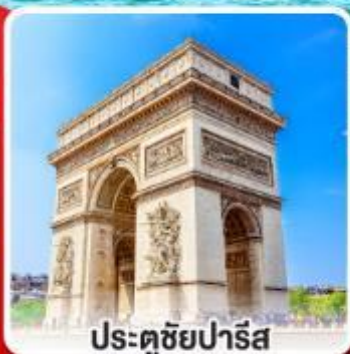
ประตูชัยปารีส

มือสุดพิเศษสุดปัง รับประทานอาหาร ระหว่างล่องเรือชมแม่น้ำแซนน์ และรับประทานอาหารบนหอไอเฟล