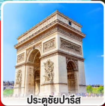
ประตูชัยปารีส

มือสุดพิเศษสุดปัง รับประทานอาหาร ระหว่างล่องเรือชมแม่น้ำแซนน์ และรับประทานอาหารบนหอไอเฟล