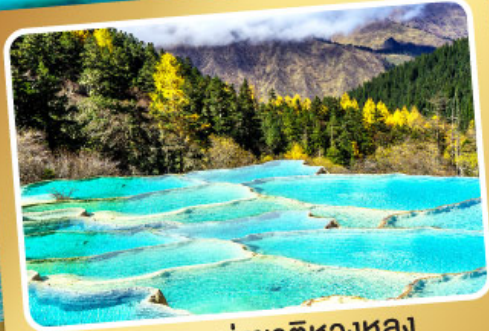
อุทยานแห่งชาติหวงหลง