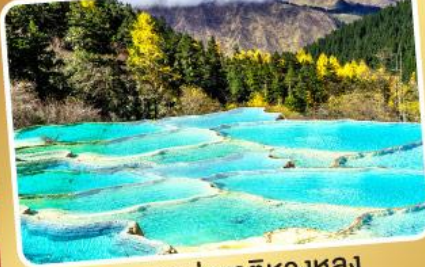
อุทยานแห่งชาติหวงหลง