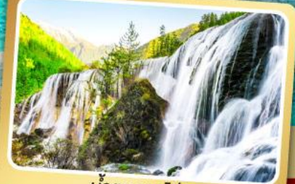
น้ำตกธารไ่บุ๊ก