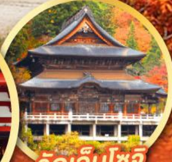
วัดเอ็นโซจิ

กิจกรรมเก็บผลไม้ พักออนเซ็น 2 คืน พักโรงแรมในโตเกียว 2 คืน