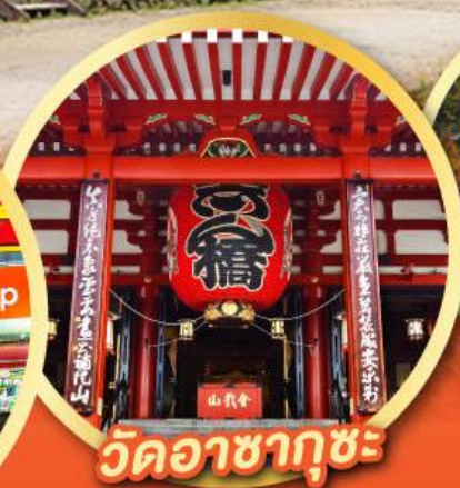
วัดอาซากุซะ