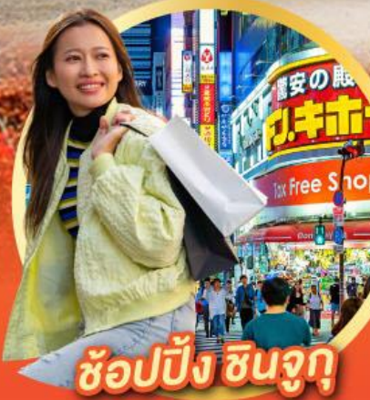
ช้อปปิ้ง ซินจูกุ