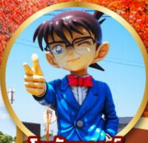
โคนันทาวน์