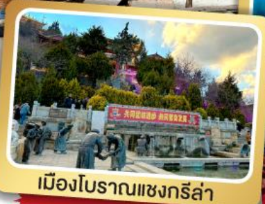
เมืองโบราณแซงกรี่ล่า