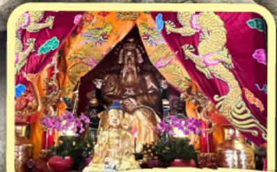
• เอียงบู๊ซิว (ศาลเจ้าพ่อเสือ)

ฟรี ประกันสุขภาพ และอุบัติเหตุ ไทยวิวัฒน์ GTIP Plus (Gold Plan) 3 ล้านบาท คุ้มครองสูงสุด *เงื่อนไขขึ้นอยู่กับบริษัทประกันภัย ความคุ้มครองเป็นไปตามกรมธรรม์ประกันภัย