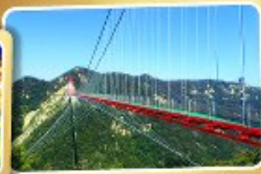
สะพานแขวนอ้ายจ้าย