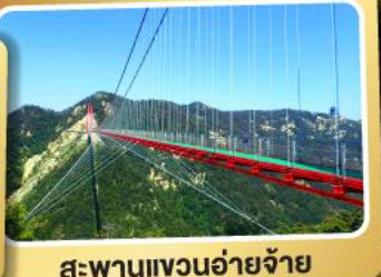
สะพานแวนอ้ายจ้าย