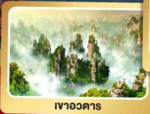
เขาอวตาร