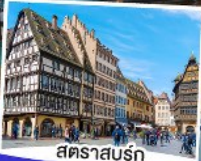
สตราสบูร์ก