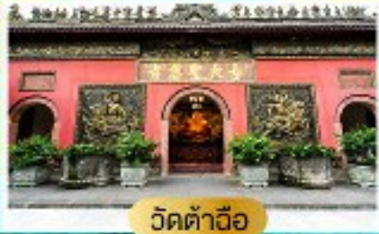
วัดต้าอ้อ