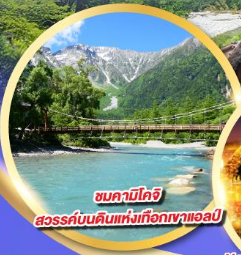
ชมคามิโคจิ สวรรค์บนดินแห่งเทือกเขาแอลป์

นั่งกระเช้าลอยฟ้า 2 ชั้น ชินโฮตากะ หนึ่งเดียวในญี่ปุ่น แลนด์มาร์กยอดฮิตของโอคุซึดะ