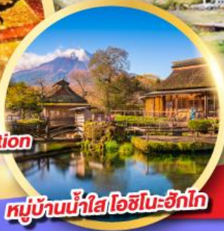
หมู่บ้านน้ำใส โอชิโนะซึกิโก