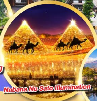
Nabana No Sato Illumination