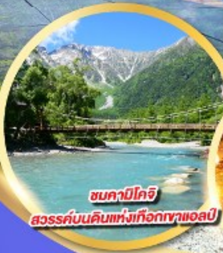
ชมคาบิโคจิ

นั่งกระเช้าลอยฟ้า 2 ชั้น ชินโฮทากะ หนึ่งเดียวในญี่ปุ่น แลนด์มาร์กยอดฮิตของโอคุซิดะ