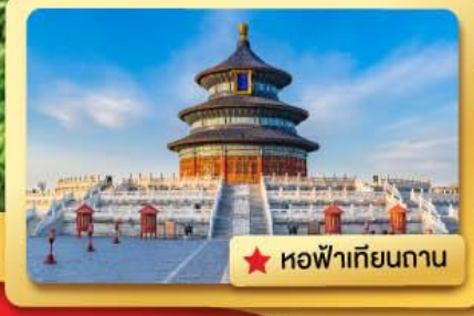
★ หอฟ้าเทียนถาน