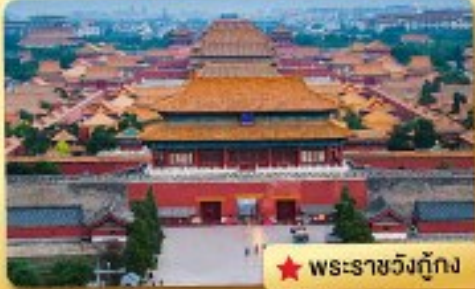
★ พระราชวังกู้กง