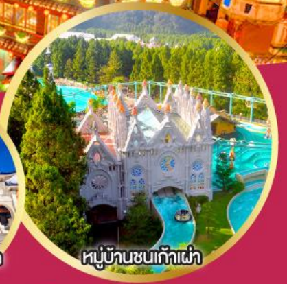
หมู่บ้านชนเก้าเผ่า