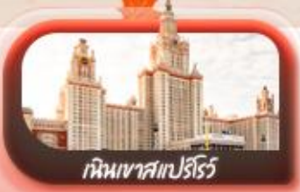
เหมินเขาสเปิร์โร