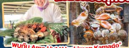
พบกับ Ama Hut "Haohiman Kamado" เมนูพิเศษ SEA FOOD