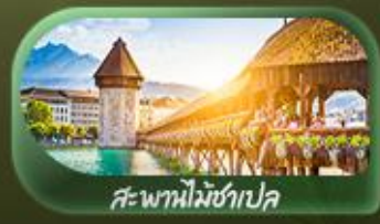
สะพานไมซ์าเปิล

ย้อนรอยความสวยงามเส้นทางสุดโรแมนติก โรม โคลอสเซียม น้ำพุเทรวี บันไดสเปน เยือนหอนอนปิซ่า ตื่นตาไปกับสถาปัตยกรรมสุดอลังการแห่งมิลาน ดูโอโม และทะเลสาบโคโม ขึ้นกระเช้า Elger Express สูดยอดเขาจุงเฟรา ที่ยอดลูซิร์น สะพานไมซ์าเปิล สิงโตแกะสลัก เยือนปารีสเมืองแห่งแฟชั่นชมหอไอเฟล ลูฟร์ มหาวิหารนอทรอดามแห่งปารีส ปิดท้ายช้อปปิ้งสินค้าแบรนด์เนมที่ เอาก์เล็ซซึนน่า