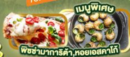
พิซซ่ามาการิตต้า, หอยเอสคาโก้