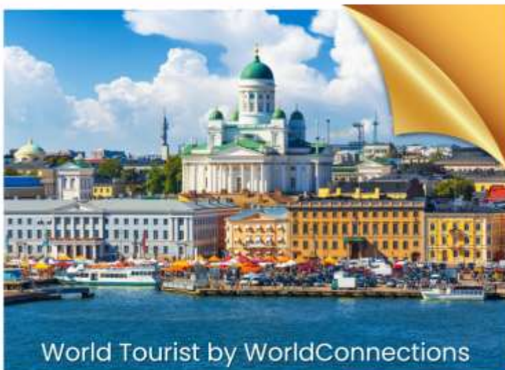
World Tourist by WorldConnections