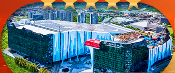
Crowne Plaza Snow World Hotel หรือเทียบเท่า S+ดีู 5 ดาว 1 คืน

เซี่ยงไฮ้ ดิสนีย์แลนด์ โอเชียนสโนวเวิลด์