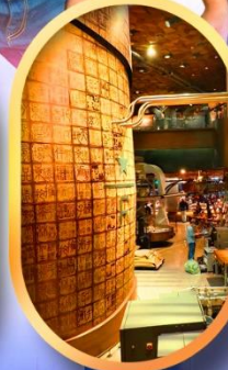
ร้านสตาร์บัคส์