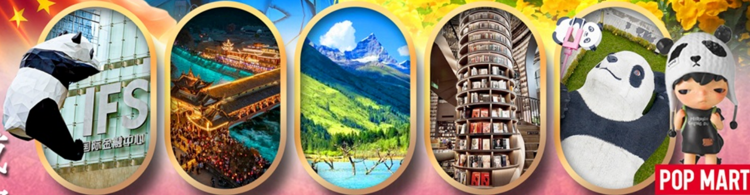
IFS หมีแพนด้าป็นตึก สะพานหนานเจียว อุทยานสี่ตุรณี อุทยานปีติงโกว หมีแพนด้าเซลฟี POP MART