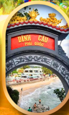
ศาลเจ้าดิงเกา