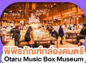
พิพิธภัณฑ์กล่องดนตรี Otaru Music Box Museum