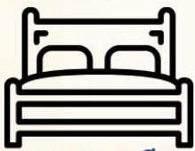
4.5-5ฟุต 1เตียง

ห้องพักเตียงดับเบิล DOUBLE BED ROOM (DBL)