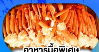
อาหารมือพิเศษ บุฟเฟ่ต์งาปู