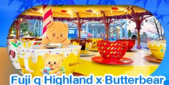
Fuji q Highland x Butterbear เดินทาง พ.ศ. 69 เป็นต้นไป